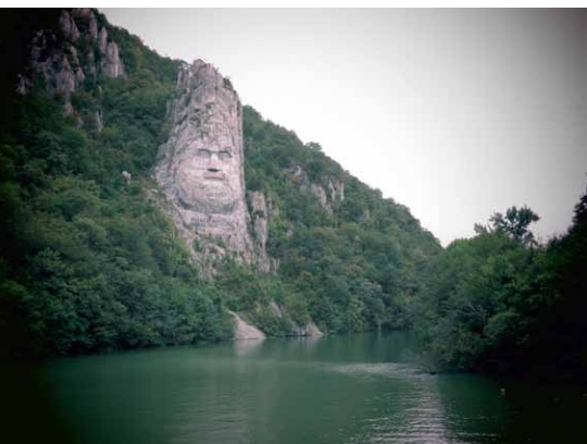
Hlava posledného kráľa Dácie, Decebalus