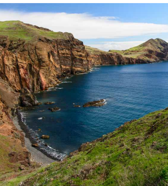
Poostrov Ponta de Sao Lourenco