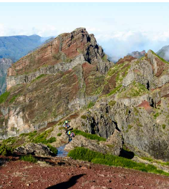
Pohľad z Pico Arieiro