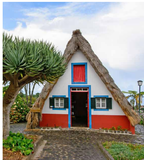
Tradičný dom v Santane

Na východnom pobreží určite stojí za návštevu polostrova Ponta de São Lourenço. Týmto polostrovom vedie polopúštna trasa až na vrchol Pico do Furado (150 m). Krajina v týchto miestach je prekvapivo odlišná od