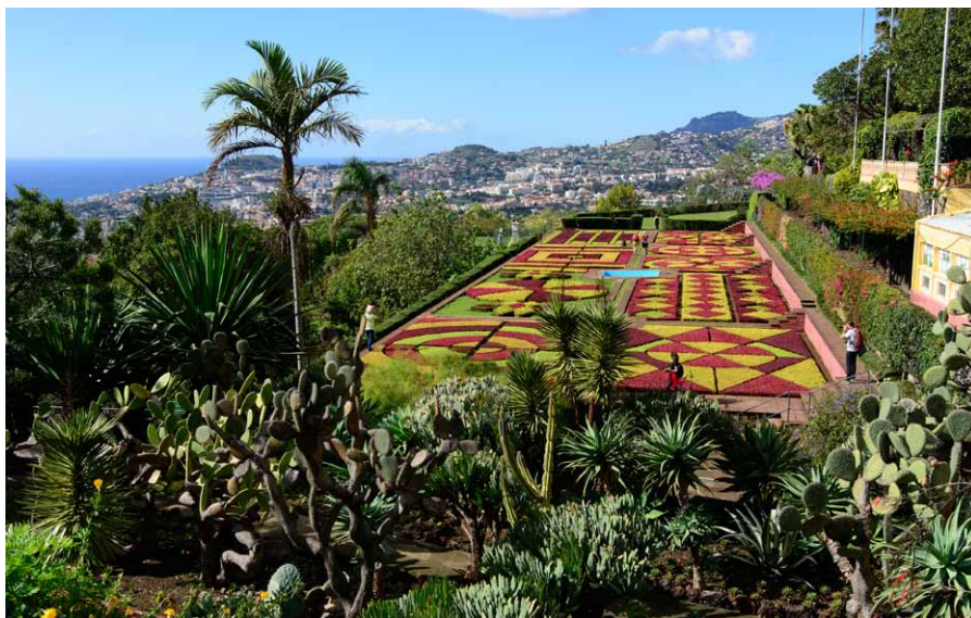
Botanická záhrada vo Funchale - Jardim Bótanico

Pre Madeiru sú charakteristické levadky – originálne zavlažovacie kanály, ktoré vybudovali otroci na zabezpečenie dodávok vody zo severu ostrova do suchších oblastí, hlavne pre južnú polovicu ostrova, ktorá má nedostatok zrážok. Celková dĺžka kanálov je okolo 2 500 km. Popri levadách vedú údržbové cesty, ktoré sú využívané aj ako turistické trasy rôznej náročnosti, od prechádzok až po vysokohorské túry. Tu je dôležité spomenúť, že je potrebná trekingská obuv, kľudne aj nízka, hlavne s dobrou, nešmykľavou podrážkou, pretože povrch chodníkov častokrát tvoria mokré klzké skaly. Každoročne v horách Madeiry predčasne ukončí svoju životnú púť niekoľko turistov, ktorí sa sem vyberú len v sandáloch. Využitie tiež nájde čelovka, pretože na viacerých trasách sa vyskytujú tunely. Tunely sa nachádzali aj v oblasti Ra-baçal, v okolí stometrového vodopádu Risco padajúceho do úzkeho kaňonu, ktorý sme navštívili. Škoda, že pokračovanie chodníka za vodopádom bolo z bezpečnostných dôvodov uzavreté. Od vodopádu sme sa vrátili na odbočku vedúcu na Levada 25 Fontes (Levada 25 prameňov). Najprv široká cesta sa za mostom zužuje do zelených tunelov strie-daných panorámami. Asi po necelej hodine sme dorazili k skalnej kotline pri kamennom moste, kde do jazierka padá 25 prameňov (odtiaľ pochádza názov tejto levady) zo skál obrastených machmi a papraďami. Je to veľmi príjemné, ale aj často navštevované