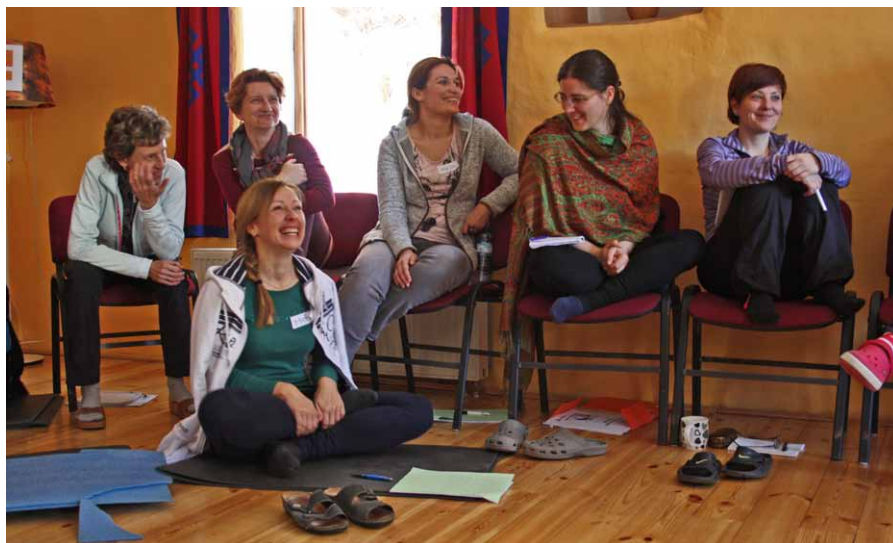
Učíme sa ako lepšie učiť