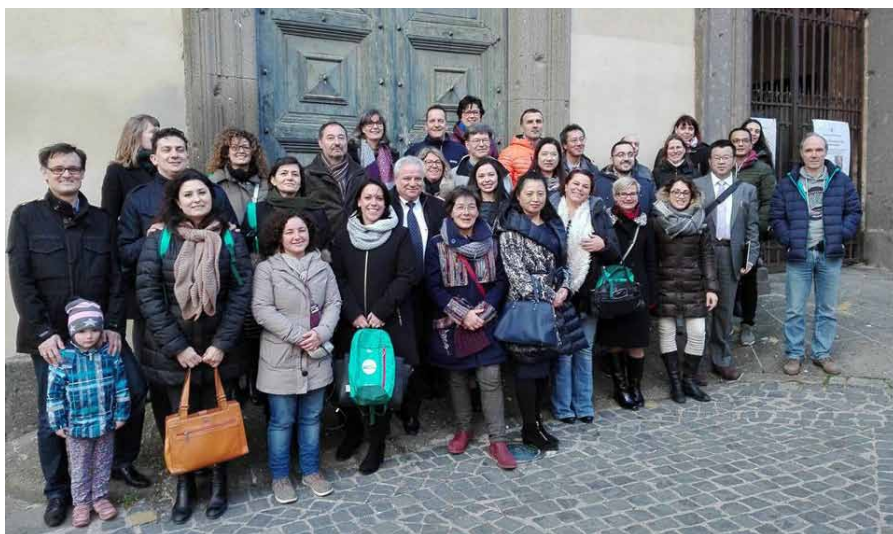
Účastníci projektu CHARMED na kick-off meetingu v Nemi, 3. – 4. február 2017