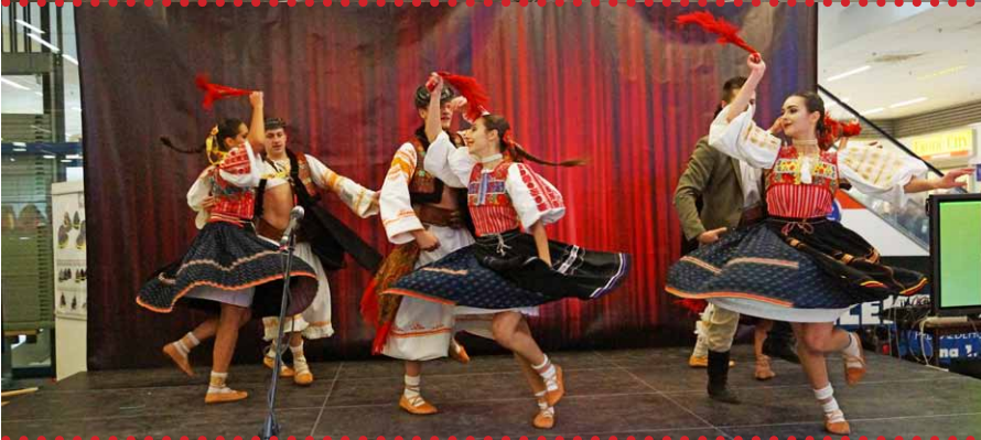
Súčasťou hlavného programu bolo aj vystúpenie folklórneho súboru Pořana