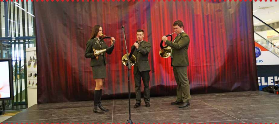
Vystúpili aj lesnícki trubači