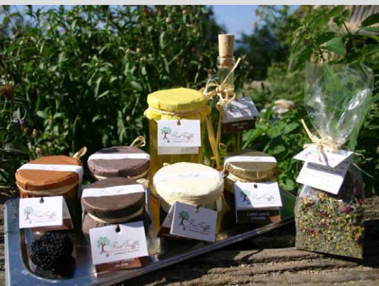
Ponuka výrobkov od Raw Truffle

vareníu na kamennej peci. Keďže komín dobre neťahal a zub času sa podpísal aj na tesnení, údenie miestnosti bolo bonusom. Veď kto by nemal rád údené vlasy, oblečenie, vypálený zrak. Vášňu pre romantiku nám dlho nevydržala (človek by neveril, koľko času také varenie zaberie) a tak sme sa rozhodli pre kúpu novej platničky. To však bolo možné len vo veľkomeste, 130 km od dediny, a tak sme boli nútení urobiť si výlet za nákupmi.