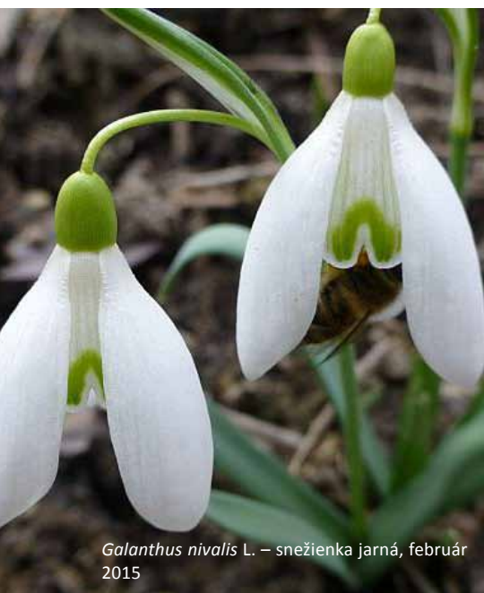
Galanthus nivalis L. – snežienka jarná, február 2015

Text a foto: Ing. Monika Offertálerová doktorandka Katedry UNESCO pre ekologické vedomie a TUR