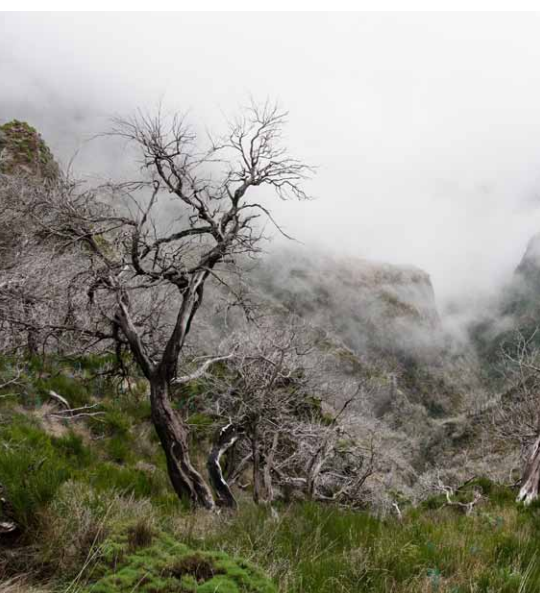
Pôsobivé scenérie cestou na najvyšší vrch Pico Ruivo

miesto a preto je potrebné uhýbať sa skupinám prichádzajúcich i odchádzajúcich turistov. Chodník je tu totiž dosť úzky. Treking údolím Rabacal pozdĺž levád patrí na Madeire k tým najpopulárnejším. Vede trochu náročnejším terénom cez treťohorný prales „laurisilva“, miestami po strmých, spravidla vlhkých, kamenných schodoch. Pralesy laurisilva zaberajú asi 30% ostrova. Laurisilva alebo vavrínový les pralesovitého typu bol vďaka svojej jedinečnosti zapísaný do zoznamu svetového dedičstva UNESCO. Laurisilva patrí k lesom, ktoré sú stále vlhké. Na Madeire sa vyskytujú na severných svahoch vo výškach 300 až 1 400 m a na južných svahoch vo výškach 700 až 1 600 m, ktoré sú každý deň niekoľko hodín pokryté hmlou. Madeirský prales je z hľadiska živočíšstva a rastlinstva z 90 % pôvodný. Nachádza sa tu vavrín Laurus azorica , ktorého plodmi sa živí holub madeirský ( Columba trocaz ), vavrín Laurus canarensis , vavrín Ocotea foetens , hrushkovec americký (avokádo) ( Persea indica ) cezmína Ilex canariensis a vresovec stromový ( Erica arborea ) i madeirský endemit Clethra arborea „Lily of the valley tree“. Údolie Rabacal je krásne a stojí za to podniknúť v ňom túru. Našu trasu sme zakončili prechodom dlhého tunela smerom do dediny Calheta, ktorý nás vyviedol na okraj eukalyptového hája. Teda skôr zvyškov eukalyptového hája. Madeiru totiž v auguste roku 2016 zasiahli na niekoľkých miestach silné požiare.